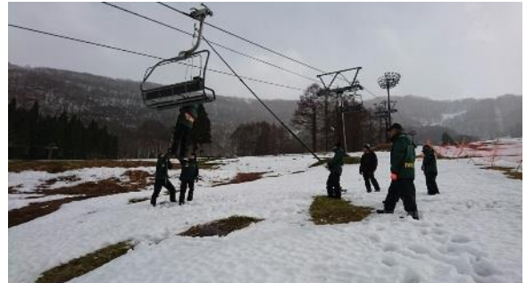
【冬季勤務前救助訓練】