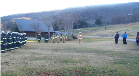
【鳥居川消防署信濃町合同救助訓練】