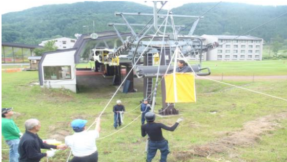
【夏季勤務前救助訓練】