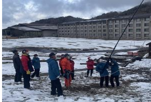
【冬季シーズン前救助訓練】