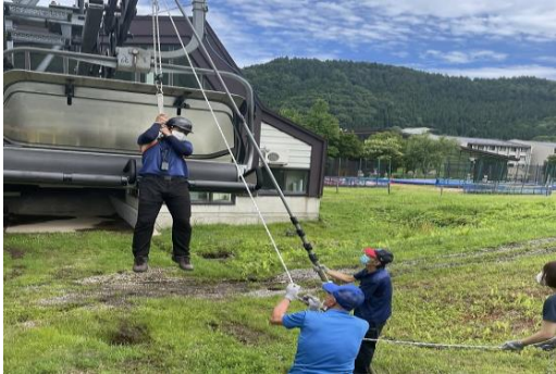
【夏季シーズン前救助訓練】