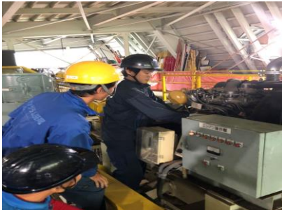
【予備原動機切替訓練】