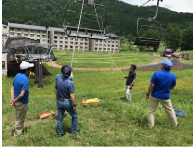
【夏季勤務前救助訓練】