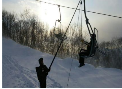
【冬季勤務前救助訓練】