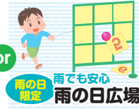
雨の白限定 雨でも安心 雨の日広場