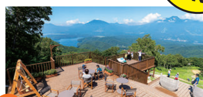
往復 野尻湖テラス観光リフト