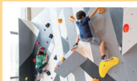
ボルダリング (プレイ代30分・シューズ付)