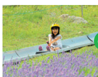
ボブスレー(2回)又は 雨の日広場プレイ券