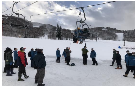
【冬季勤務前救助訓練】